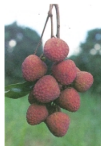
พันธุ์โอวเฮียะ

ต้นมีทรงพุ่มเล็ก งามกิ่งเป็นมุมแคบ ใบเล็กยาวสีเขียวเข้ม ยอดอ่อนสีแดง ใบมี 2-3 คู่ โคนใบและปลายใบเรียวแหลมเป็น พันธุ์หนักออกดอกติดผลไม่ค่อยสม่ำเสมอผลมีขนาดเล็กผลทรง คล้ายรูปหัวใจป้อมมีไหล่สูงทั้งสองด้าน ผิวผลมีสีแดงเลือนนกก่อนข้าง คล้ำ หนามที่ผิวเรียบห่าง เปลือกหนาเนื้อหนามมีสีขาวชุ่ม เนื้อนุ่มฉ่ำ น้ำ มีกลิ่นหอม เมล็ดเล็กสับผลแก่ช้ากว่าพันธุ์สงฮวยประมาณ 2 สัปดาห์