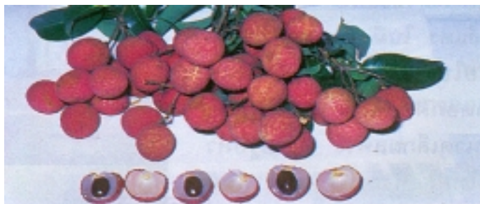
พันธุ์กิมเจ็ง

ฤดูกาลเก็บเกี่ยว เดือนพฤษภาคม - มิถุนายน