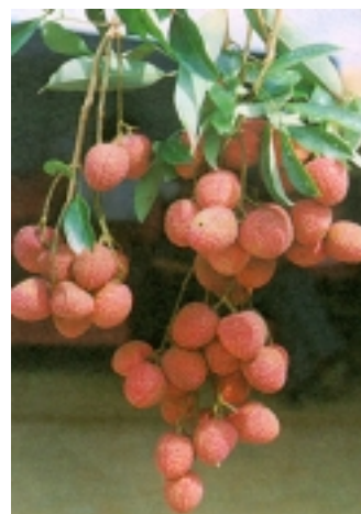
พันธุ์สงฮวย

ต้นที่ทรงพุ่มใหญ่ ลำต้น สีน้ำตาลอมเทา ช่วงข้อบนกิ่งห่าง ใบหนา สีเขียว ขอบใบบิดเป็นคลื่นปลายใบไม่ค่อยแหลมใบมี 3-4 คู่ ยอดสีเขียวอ่อนปนเขียว ให้ผลดกติดผลดีสม่ำเสมอ ลักษณะผล ทรงยาวรีคล้ายรูปไข่ เปลือกบาง ผิวสีแดงปนชมพู เนื้อสีขาวชุ่ม รสหวานอมเปรี้ยวเล็กน้อยเมล็ดโต เปลือกบางทำให้ชอกช้ำง่ายและ รับประทานง่าย