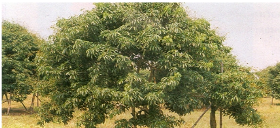
การปลูกลันจี้ในพื้นที่ดอน

พื้นที่ซึ่งเป็นที่ลุ่มจำเป็นต้องยกร่อง ควรยกแปลงให้มีความกว้างของแปลงอย่างน้อย 6 เมตร ร่องลึก 1 เมตร กว้าง 2 เมตร เพื่อระบายน้ำให้ฤดูฝนและกักน้ำให้ฤดูแล้ง