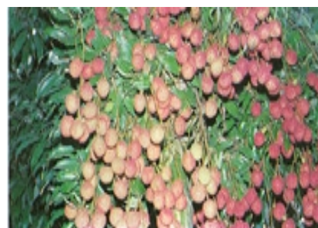
พันธุ์ค่อม