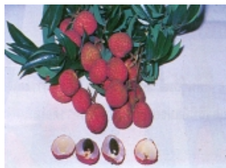
พันธุ์จักรพรรดิ

ฤดูกาลเก็บเกี่ยว เดือนพฤษภาคม - มิถุนายน