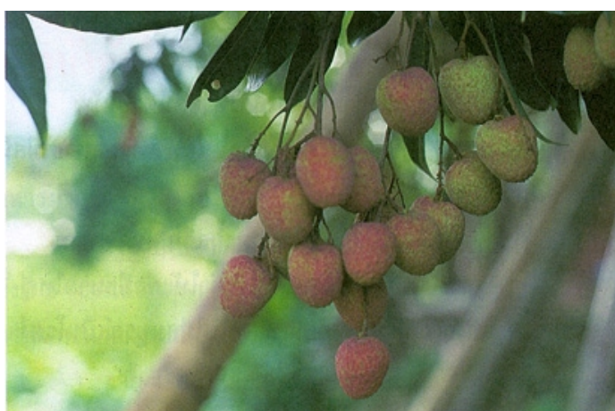
เปลี่ยนสีเตรียมห่อผล

เมื่อผลลิ้นจี่แก่ คือ หลังจากดอกบานประมาณ 4 เดือน หรือสังเกตจากขนาดผลโตเต็มที่ สีของผลจะเปลี่ยนจากสีเขียวเป็นสีชมพูปนแดง ใหลงกลกว้างออก ฐานของหนามที่เปลือกจะขยายออก ปลายหนามแหลม ร่องหนามถ่างออกเห็นได้ชัด เนื้อแห้ง กลิ่นหอม รสหวาน เมล็ดมีสีน้ำตาลเข้มเป็นมัน